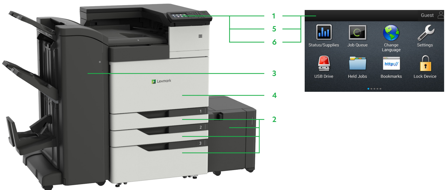
C9235 mit Optionen

Drucken Sie Microsoft Office-Dateien, PDFs und andere Dokument- und Bildarten von Flash-Laufwerken, oder wählen Sie Dokumente auf Netzwerk-Servern oder Online-Laufwerken aus und drucken Sie sie.